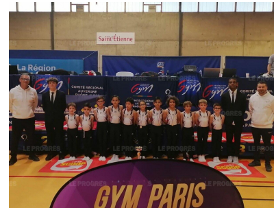
Les gymnastes du CMO Vénissieux Gymnastique en lice ce dimanche à Saint-Étienne.

pour le club, fier de la performance de ces jeunes athlètes. ■