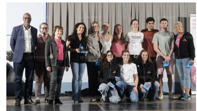
Les récipiendaires du CMO Vénissieux Natation, le plus gros club de la ville avec 1 358 adhérents.