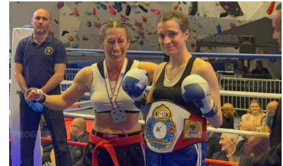
Une victoire en quelques secondes.

les premières secondes, le scénario bascule : un chassé bien placé ouvre le front de son adversaire. Le médecin intervient et stoppe le combat. C'est une victoire par arrêt médical pour Justine. « J'avais encore beaucoup d'énergie pour mener ce combat au bout », assure la championne. Sa ceinture, conquise avec détermination, elle la dédie chaleureusement à son mari, son coach Jean-Alexis et son club. ■